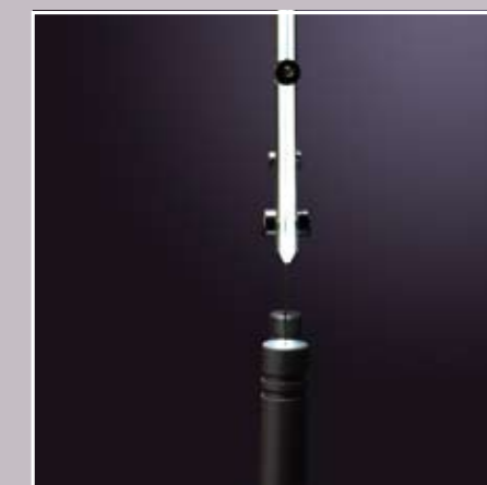
sur câble Sol/plafond ou en Lest