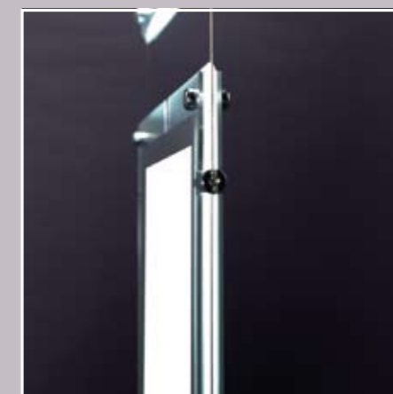
épaisseur 12 mm